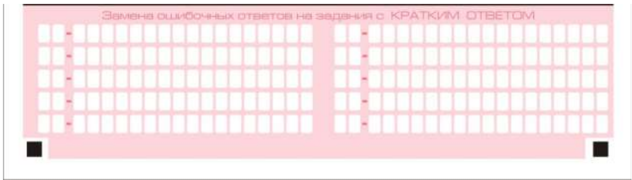
Рис. 8. Область замены ошибочных ответов на задания с кратким ответом

В нижней части бланка ответов № 1 предусмотрены поля для записи исправленных ответов на задания с кратким ответом взамен ошибочно записанных (рис. 8).